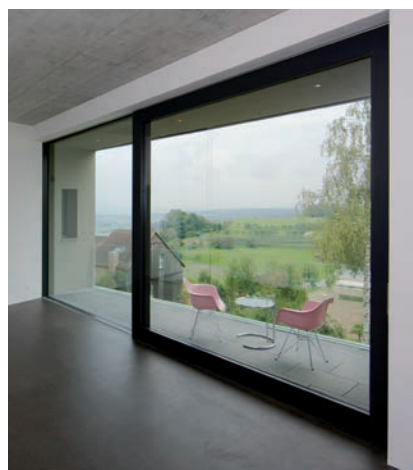
Hebeschiebetüre CONNEX cube