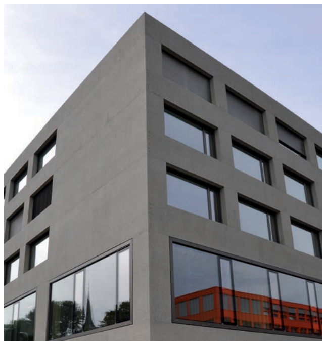
Schulhaus, Altstätten (CONNEX cube)