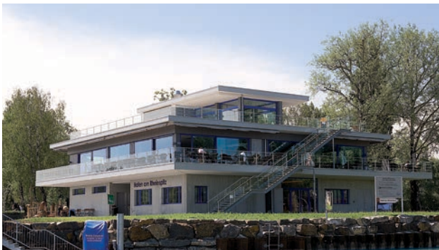
Restaurant Rheinspitz, Altenrhein

Durch die Verglasung von aussen kann im Innenbereich auf eine sichtbar geschraubte Glasleiste verzichtet werden. Mit dieser Verglasungsvariante werden nicht nur Höchstwerte in puncto Dichtigkeit erreicht; auch die oft sehr grossen und schweren Gläser können von aussen problemlos und schnell eingesetzt werden. Die dazugehörige Glassicherung garantiert eine zuverlässige Einbruchhemmung und Absturzsicherung. Das Resultat ist eine technisch sowie ästhetisch überzeugende Hebeschiebetüre. Optional kann die Verglasung direkt in unterschiedliche Schwellensysteme integriert werden. Realisierbar sind auch barrierefreie Lösungen. In jedem Fall wird der sichtbare Rahmen auf ein Minimum reduziert und ein Maximum an Durchsicht und Lichteinfall runden das Erscheinungsbild ab.